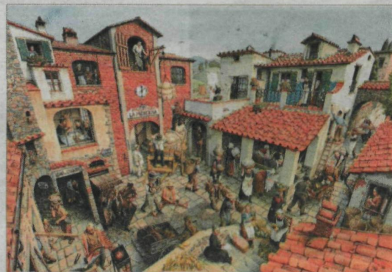
• Jedna z mniej mrocznych ilustracji Roberta Innocentiego

* „Pinokio” – Włoski Instytut Kultury, ul. Marszałkowska 72, tel. 22 628 06 10 26.10, godz. 18 wstęp wolny (liczba miejsc ograniczona)